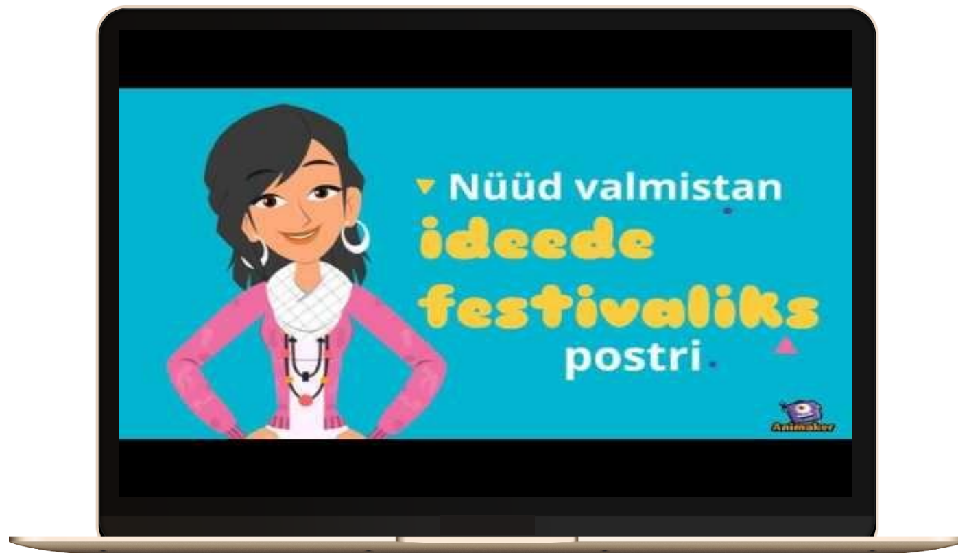
Tallinna Rahumäe Põhikooli Loovtööde Idee Festival 2018 trailer